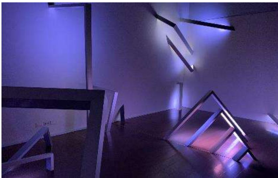
圖：光景-江元皓影音藝術展