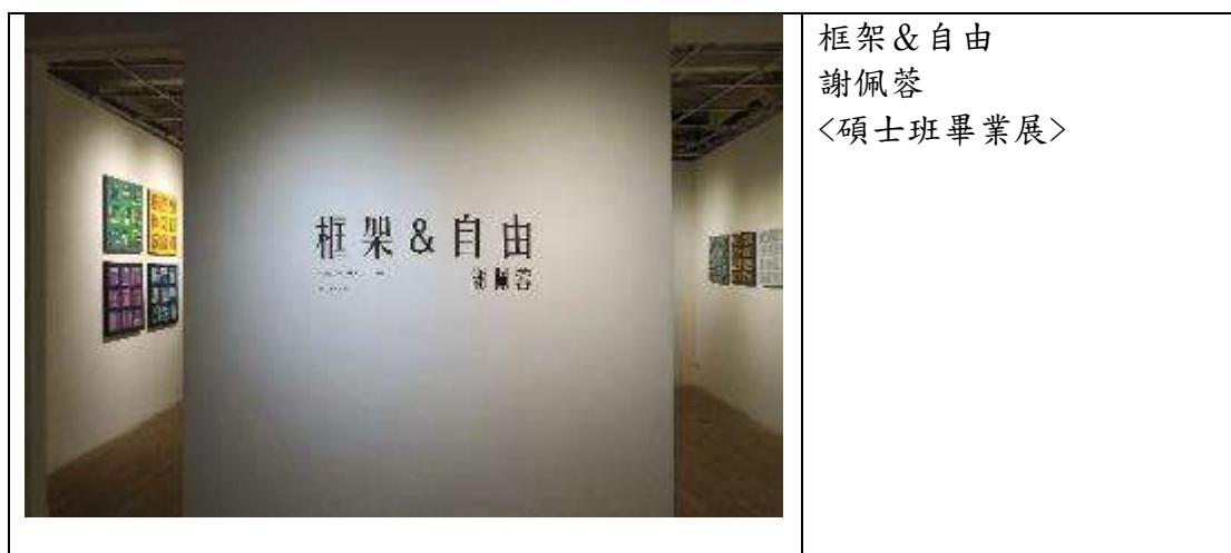
框架&自由 謝佩蓉 〈碩士班畢業展〉