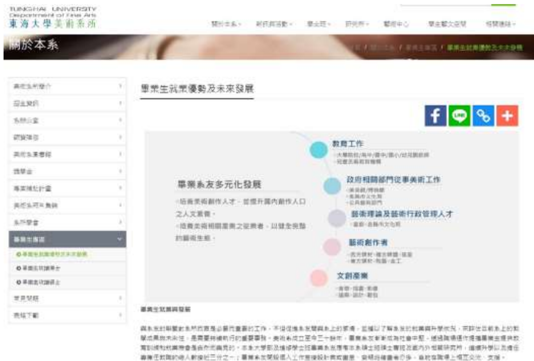
圖：美術系網站-畢業生專區

https://www.facebook.com/thufineart1983/