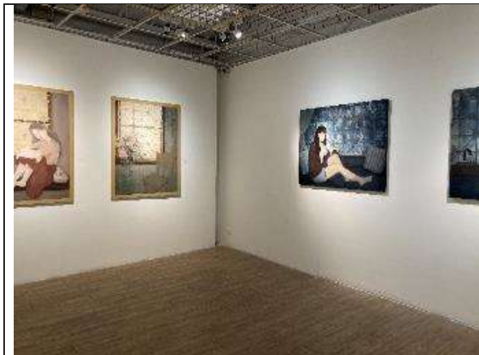
憶·念 鄭友盈、林品依 〈日間學士班畢業預展〉