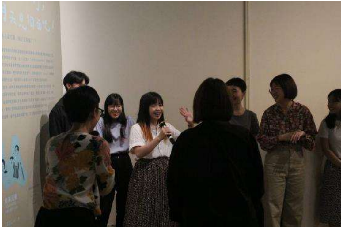
圖：東海團隊成員介紹。