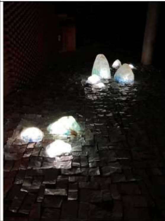
109 學年度作品 《澗》