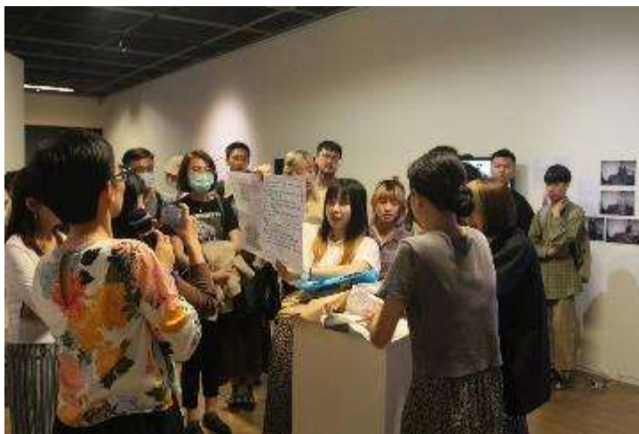
圖：開幕時與觀眾一起打開由波蘭團隊寄來的包裹。