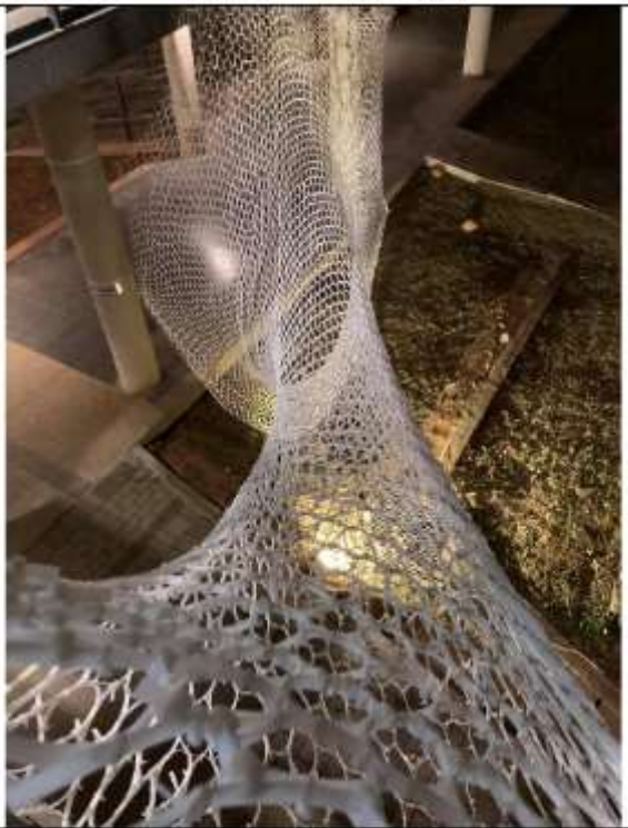
109 學年度作品 《透》