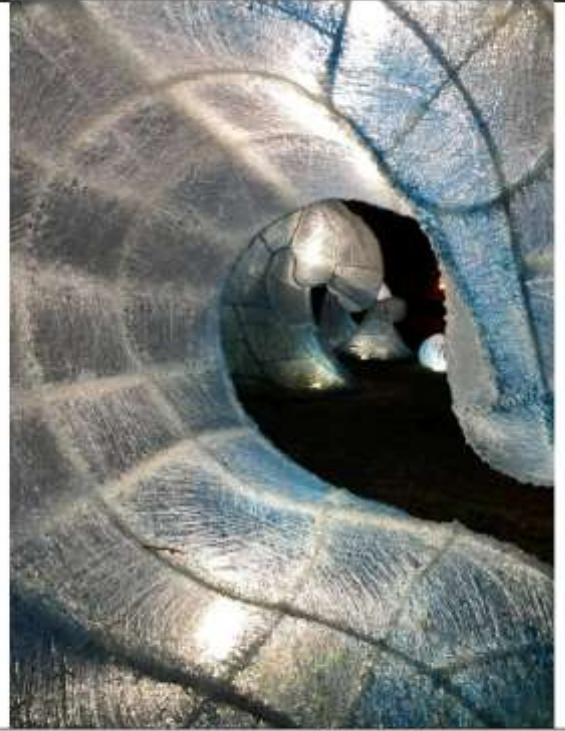
109 學年度作品 《斗·良》