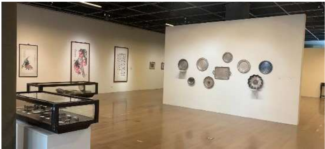
圖：東海密碼-東海大學佩蓉館典藏展