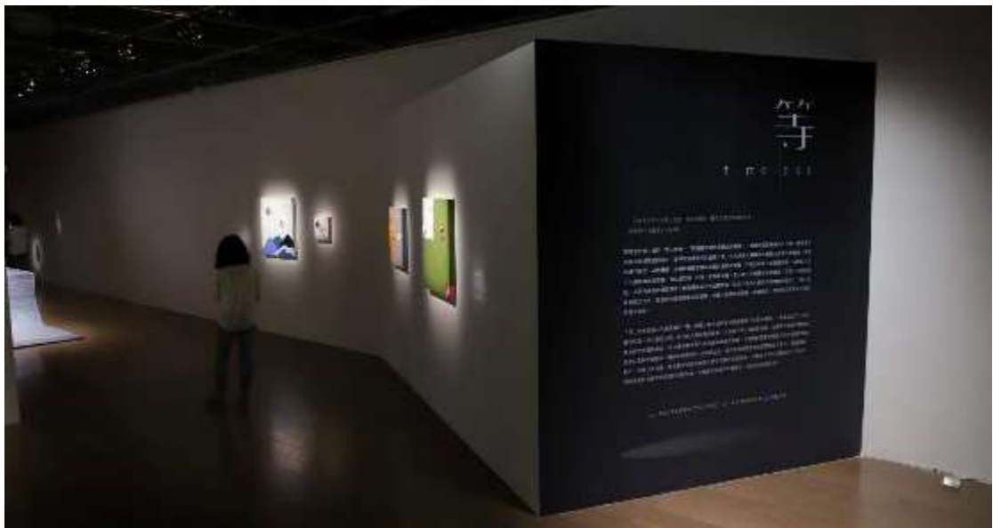
圖：等-在可測與不可測的時間之中迴旋（東海大學美術研究所第十屆實習策展）