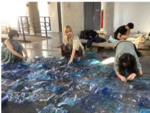
學生創作作品過程