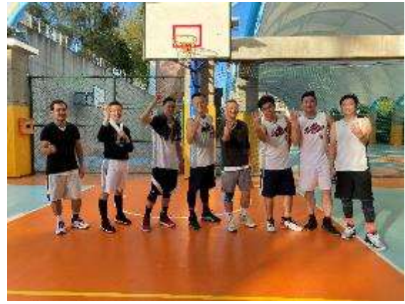
圖：第 15 屆美術系友盃籃球賽於 2020 年 12 月舉辦

5.傑出系友返校展覽：東海大學藝術中心作為一個專業展場，無論是透過本系專任教師策劃或是規劃，經常邀請傑出系友返校展出。比如 2019 年 12 月由本系段存真與蔡明君兩位老師策劃了「藝術日常進行中」，除了邀請到西班牙藝術創作雙人組 Lobet&Pon，更邀請李明學和劉耀中兩位同樣亦是以日常生活為題材創作的傑出系友藝術家一同參展。而 2020 年 3 月林彥良老師策展"人生 50. 相遇 30"，結合東海大學美術系第八屆 22 位系友聯展，分享不同的人生發展。經過東海大學美術系的教育薰陶下的系友，於各行各業都有其發展的舞台，此展覽不僅是系友作品展覽的同學會，更檢視並分享美術教育對創作者養成的成果。