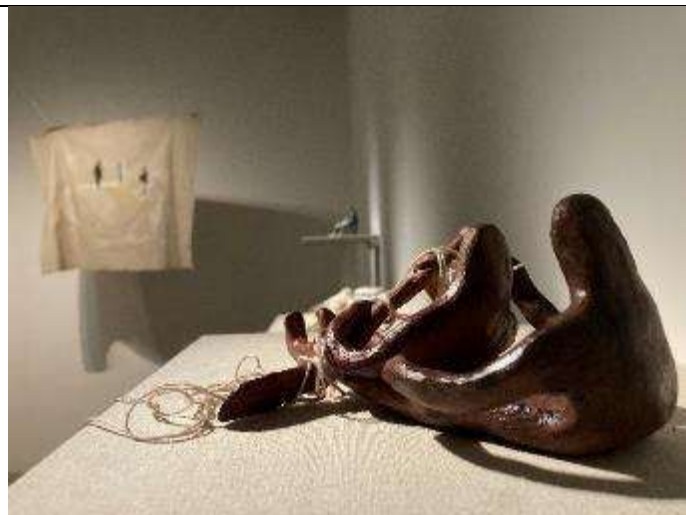
沾黏/疤痕組織 徐晴 〈日間學士班畢業預展〉