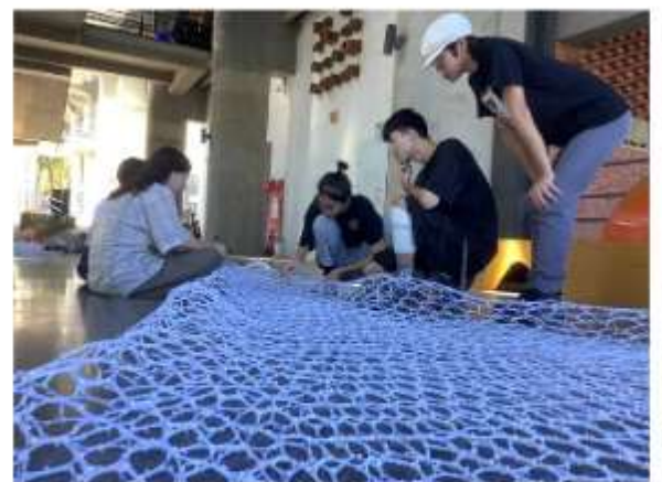
學生創作作品過程