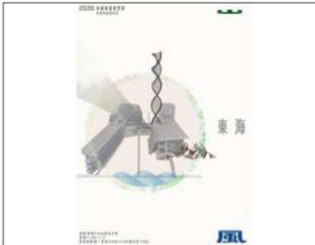
109 聖誕裝置模型展海報