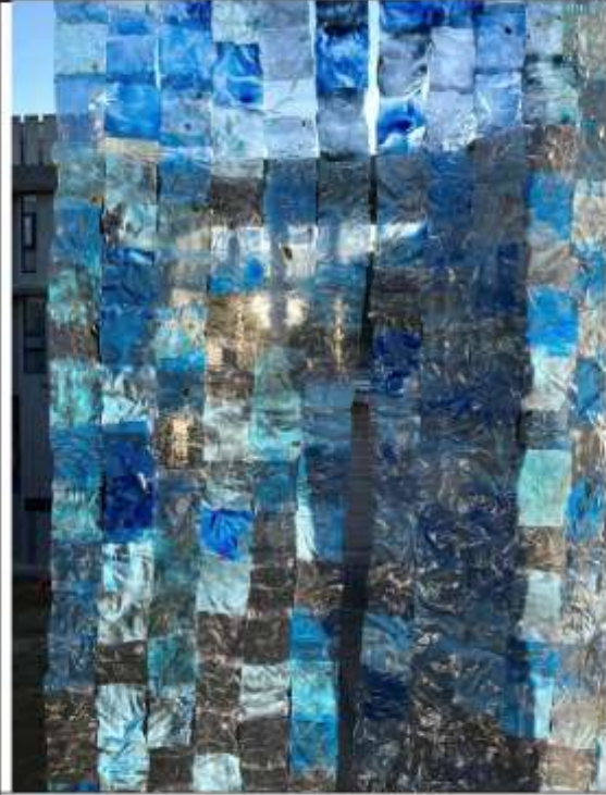
109 學年度作品 《漫》