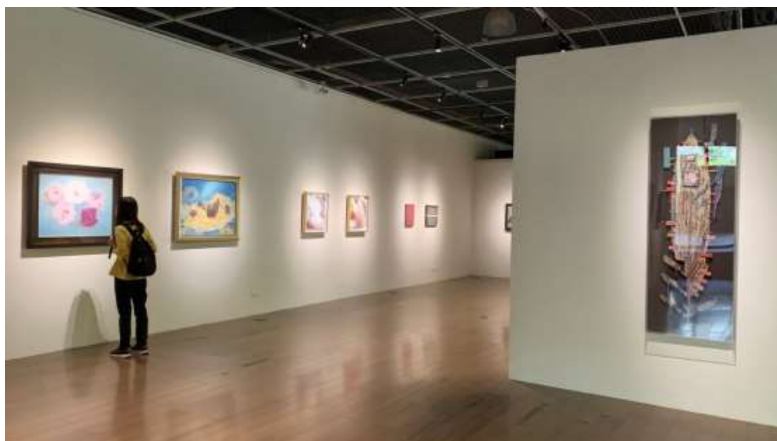
【圖】各自表述--膠彩媒材的地域性與時代樣式