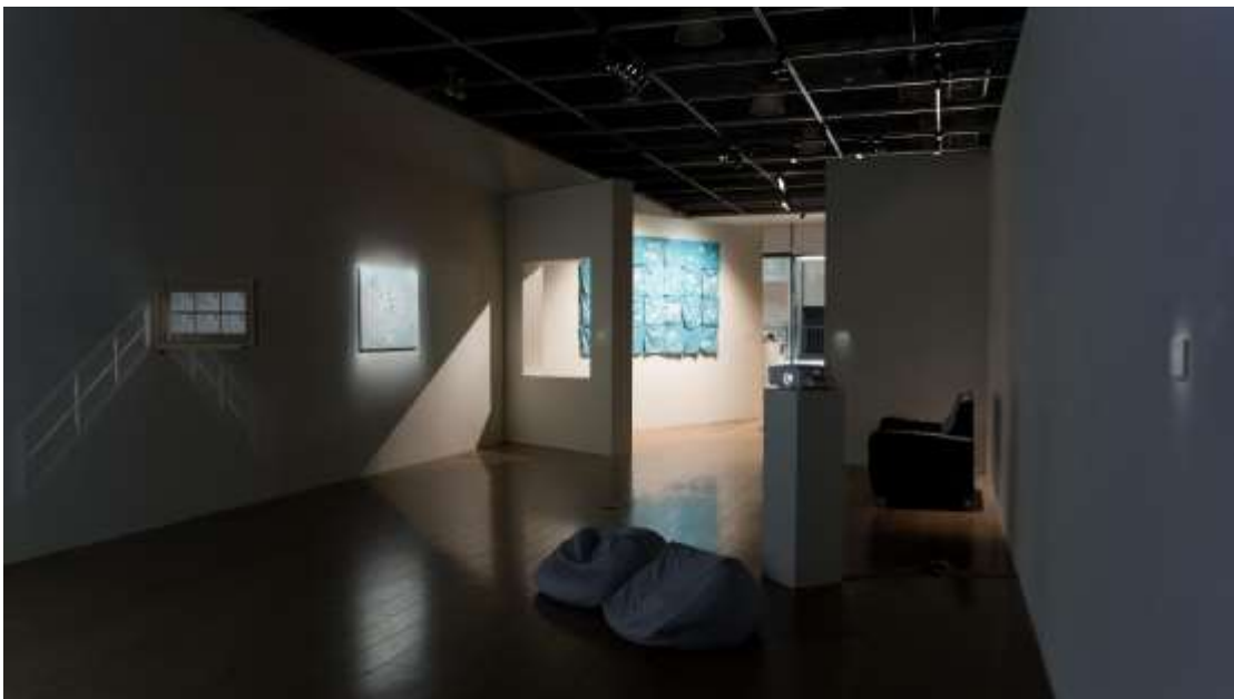
【圖】Don' t BeMO 與你心電感應-東海大學美術研究所第 10 屆實習策展