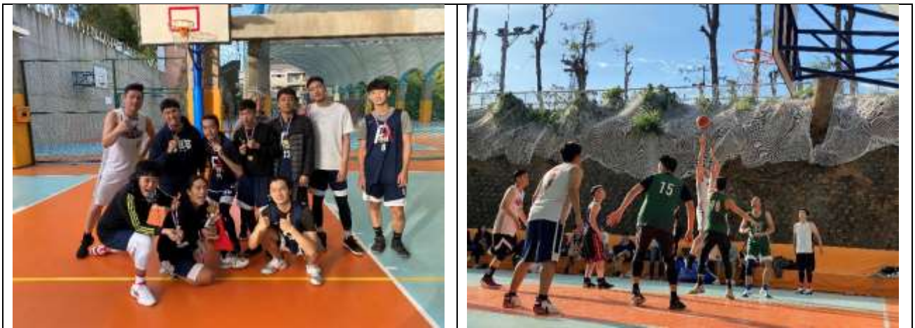
美術系系友盃籃球賽盛況

本系自 2000 年來，日間學士班、進修學士班及碩士班系友不定時舉辦籃球賽聯誼，自 2011 年起透過 FB 社團號召，參與者眾，規模日益擴大，校生與系友透過籃球運動情感聯繫熱絡。