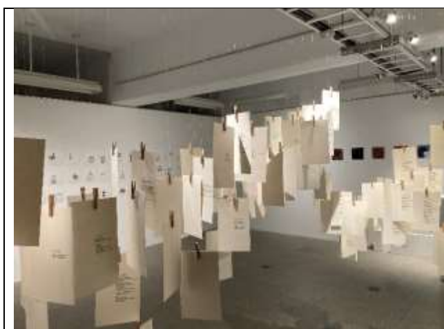
凝視微光 | 陳亞琦 <碩士班申請展>