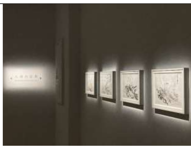
《大湖山莊街》 | 田歆 <學士班畢業預展>