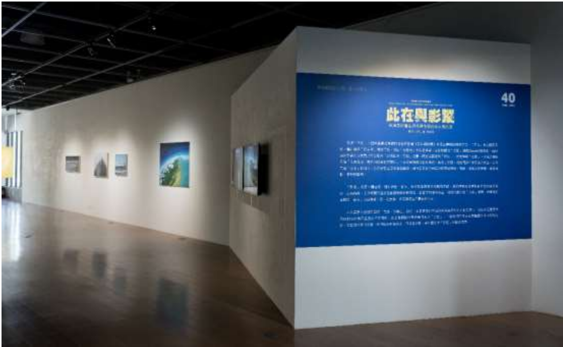
【圖】東海美術創系四十週年大系②：此在與影蹤-東海美術僑生與外籍生留臺系友邀請展