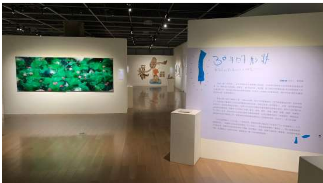
【圖】30 年的形狀—東海美術第六屆的三十功名