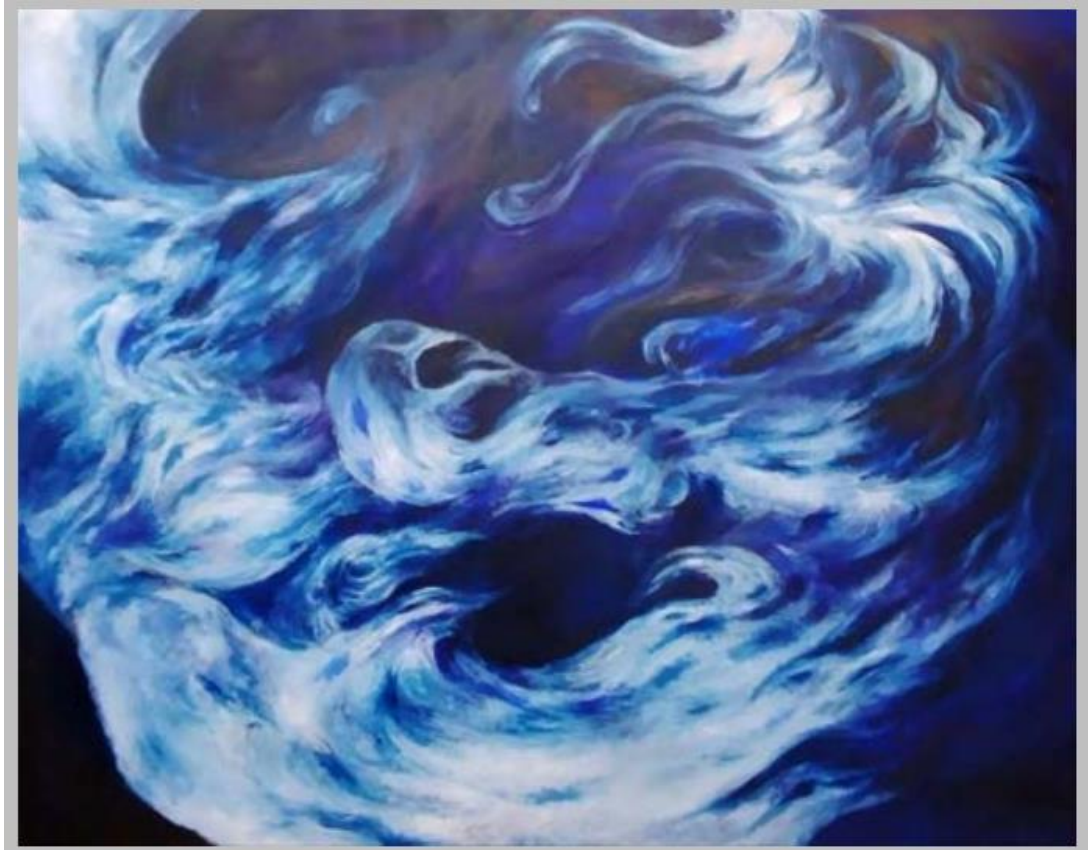
06. 林以昕、〈無邊際的不安〉、2023、油彩、畫布、116.5x91 cm