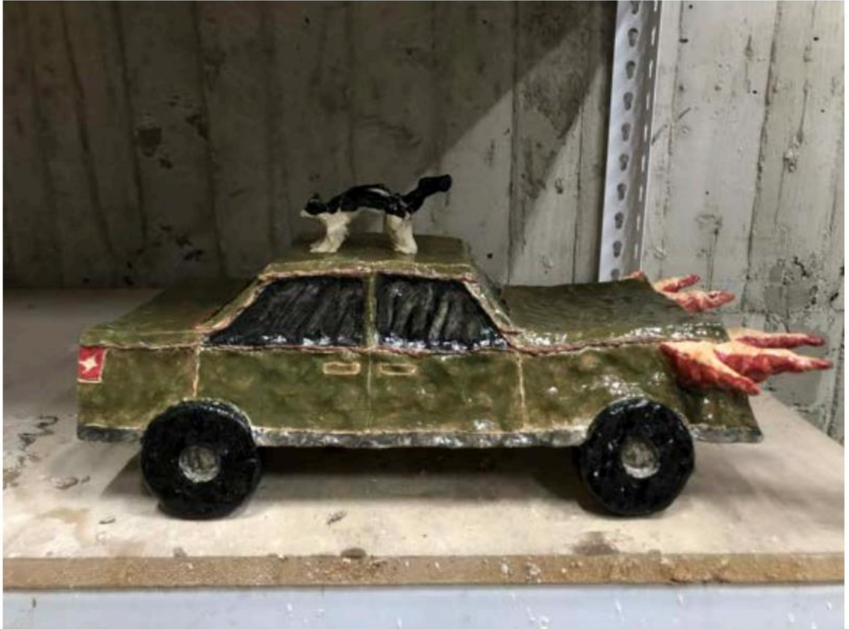
04. 陳孟潔、〈賓士車〉、2023、白陶土、釉料、48 x 25 x 22 cm