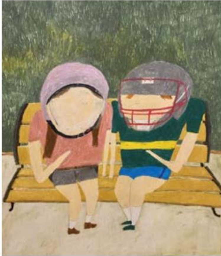
05. 蔡漳安、〈公園裡的談話〉、2023、油畫棒、色鉛筆、木板、72.5 x 60cm