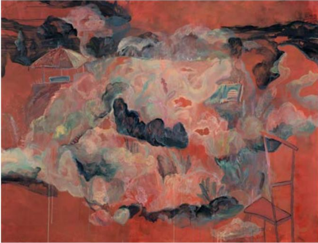
02. 田歆、〈窗型〉、2022、壓克力彩、色鉛筆、畫布、130 x 170 cm