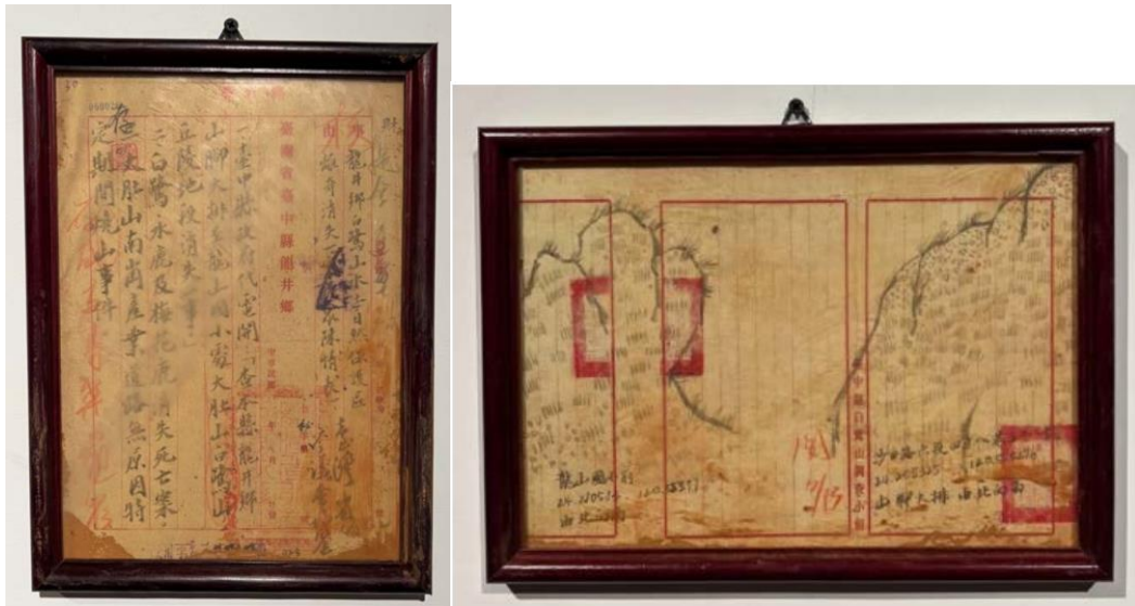
07. 林暉宸、〈白鷺山〉、2023、墨、紅土、紙本、27 x 19.5 cm