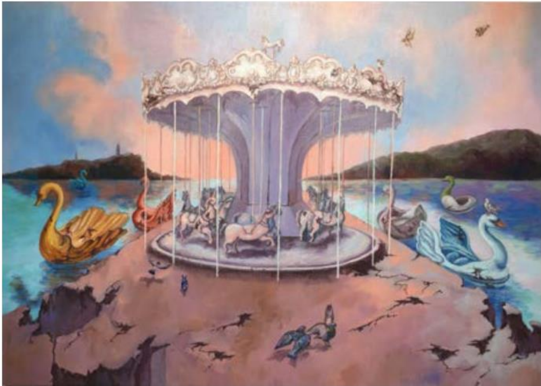
03. 劉藝瑤、〈樂園〉、2023、油彩、畫布、65 x 91 cm