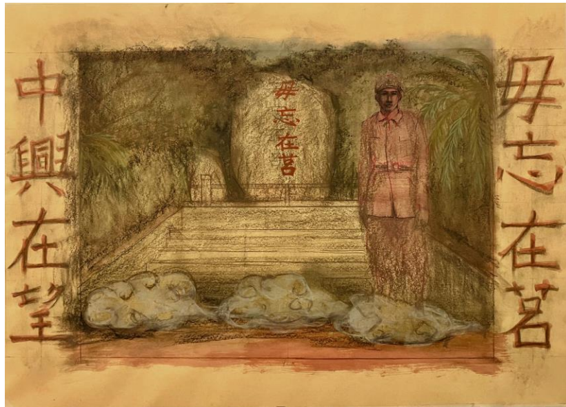
04. 〈大好河山 05〉、2022、炭筆、粉彩、牛皮紙、75 x 110.5 cm