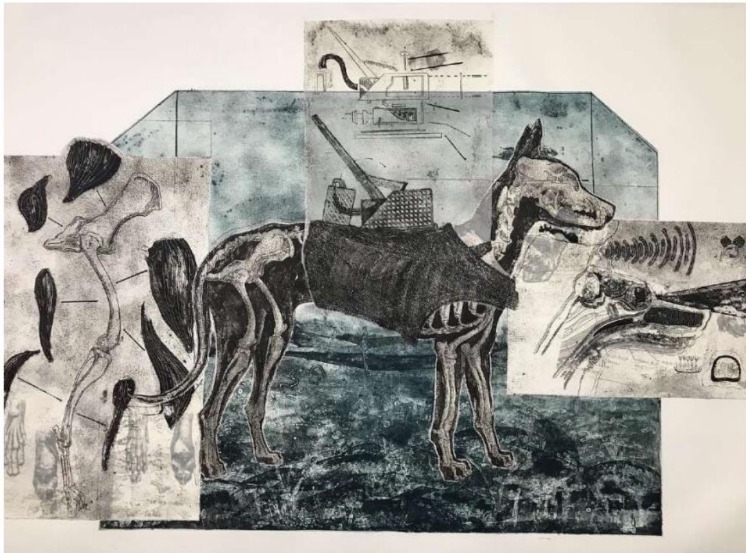
06. 潘奕愷、〈戰爭舫物〉、2022、版畫、78 x 110 cm