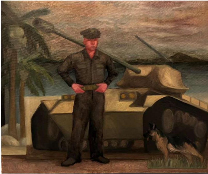
01. 吳梓和、〈大好河山 03〉、2022、油彩、畫布、38 x 45.5 cm