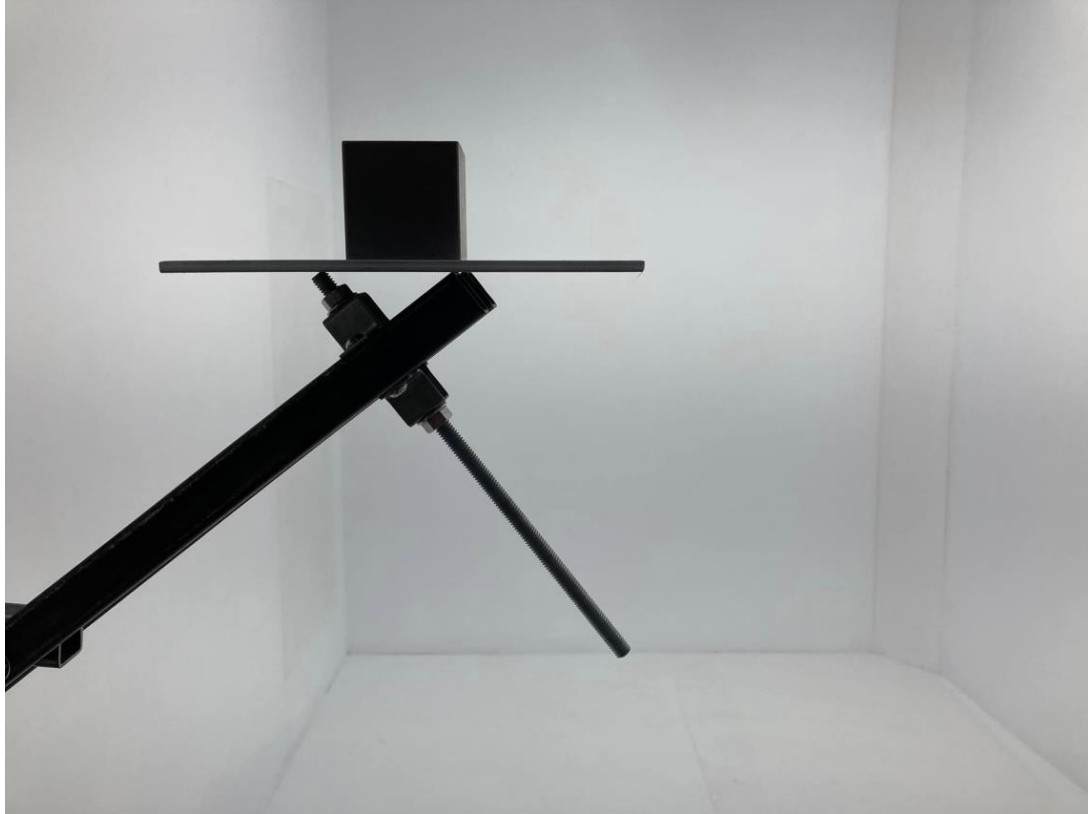
08. 林煜峻、〈Get a closer look!〉、2023、複合媒材、大小依場地而定