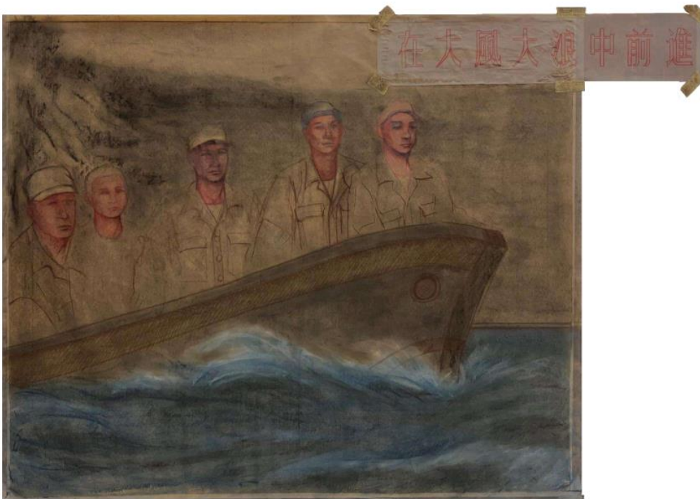
02. 吳梓和、〈在大風大浪中前進〉、2022、炭筆、粉彩、牛皮紙、75 x 110.5 cm