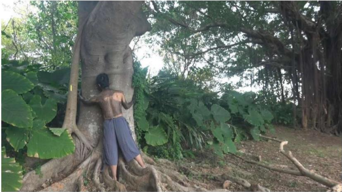
05. 王辰男、〈拓印〉、2022、行為錄像、4 min