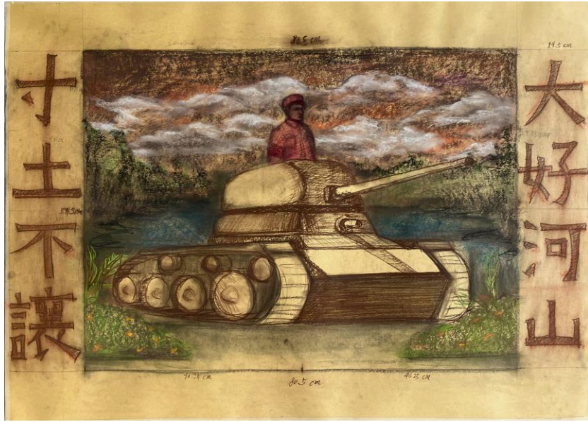
03. 〈大好河山 04〉、2022、炭筆、粉彩、牛皮紙、75 x 110.5 cm