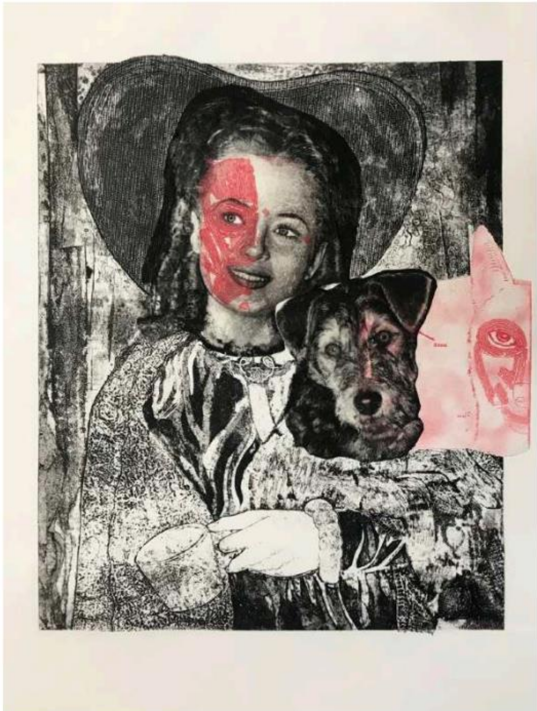
07. 潘奕愷、〈迷人的眼神〉、2022、版畫、54 x 38cm